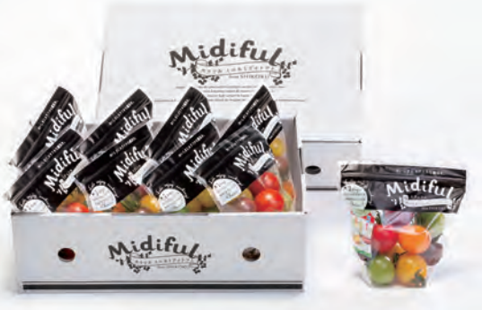
①ミディフル BOX (2kg)

ミディフルは、四国で生まれ育ったカラフルなミニ&ミディトマトです。四方を海に囲まれ、温暖で自然あふれる四国。ミディフルはそんな自然の恵みをたっぷりと受けて育てられています。7色のカラフルトマトは、色ごとに味わいも食感も異なります。酸味と甘みのバランスが整ったカラフルトマト。いつもの食卓にカラフルな彩りと美味しさをどうぞ。