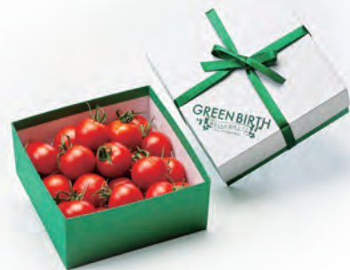
④グリーンバース GIFT (600g)

申込書 株式会社四電工 CAD 開発部 FAX:0120-60-2421 または FAX:089-946-5000