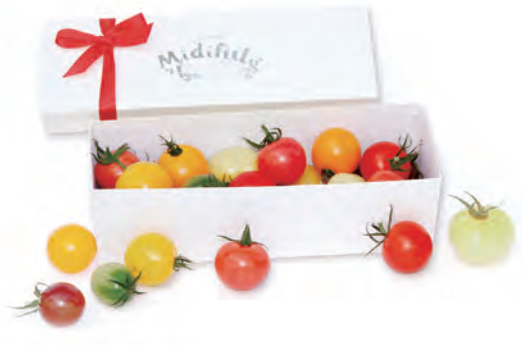
②ジュエルミディフル (600g)