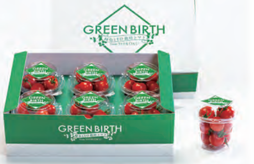
③グリーンバース BOX (1.5kg)

*当社シンディースイート種比。生鮮食品のため季節により変動があります。鮮度保持効果とは収穫後の水分損失を防ぐ効果を指します。