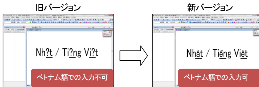
【多言語対応の入カイメージ(例:ベトナム語)】